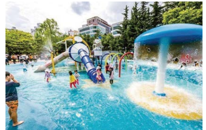
반달공원 내 어린이 물놀이 분수대

반월동의 고질적인 주차 문제를 해결하겠습니다. 반월농협 복개천 일대가 주차난이 심각하므로 주변의 토지를 매입하여 주차타워를 조성하는 등 체계적인 주차환경을 만들겠습니다.