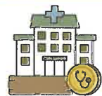
소아청소년과 야간휴일 운영 달빛병원, 약국 운영 확대