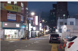
상가 LED 조명설치