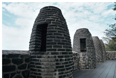
문화유적 복원사업 청통·신녕 봉수대 복원사업 (국가지정 사적지)