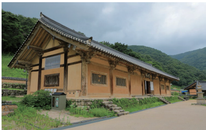
거조사 (영산전&오백나한상) 유네스코세계유산 등재 추진