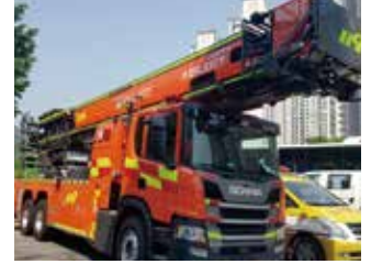
웅상119안전센터 53m 고가사다리장비 유치 및 배치