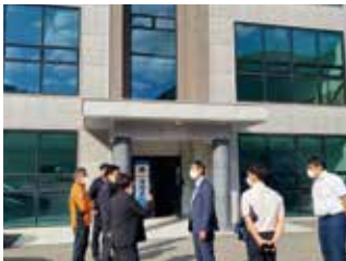
양산소방서 동부119출장소 신설