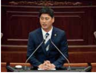
부울경메가시티 동남권광역철도선도사업 선정