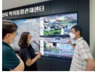
양산시 악취관리센터 설치