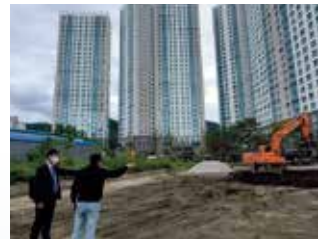
덕계동 우성아파트 앞 주차난 개선차원 임시주차장 건설