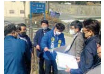
회야강 하천재해예방사업 206억원 확보