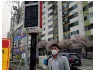
미세먼지 및 오존신호등 설치