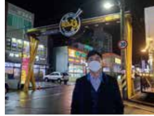
평산동 먹자골목 상권활성화사업 -아치조형물 설치