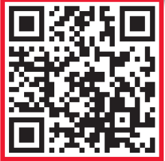
▲이주형 더 알아보기