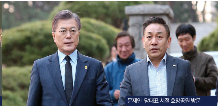
문재인 당대표 시절 효창공원 방문