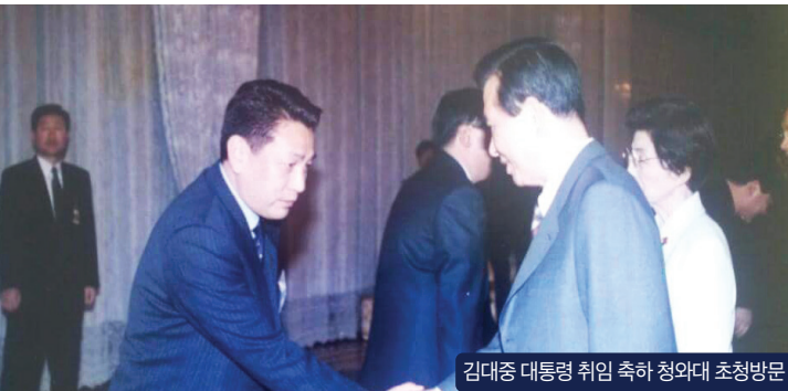
김대중 대통령 취임 축하 청와대 초청방문