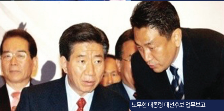
노무현 대통령 대선후보 업무보고