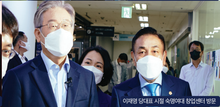
이재명 당대표 시절 속명여대 창업센터 방문