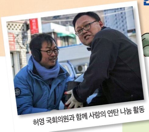
허영 국회의원과 함께 사랑의 연탄 나눔 활동

150만여 장의 연탄을 한 줄로 이으면 225km, 서울과 춘천을 왕복하고도 남는 진심의 거리입니다.