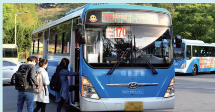
김해-창원 간 시내버스 광역 무료 환승