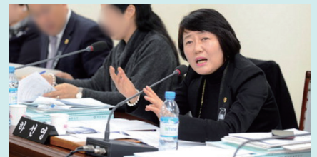
교육 등 맞춤형 조례 제정