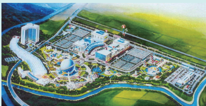
롯데관광유통단지 난제 해결