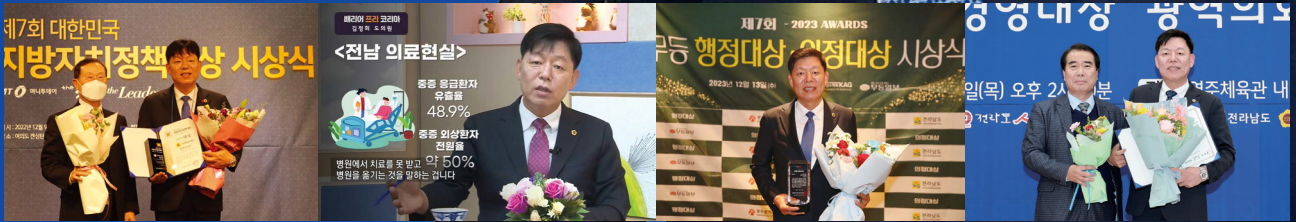
제7회 대한민국지방자치정책대상, 의정부분 '대상' 수상 [머니투데이(the300·the Leader), 2022. 12. 9.] 제8회 대한민국 복지TV 나눔실천 복지대상 '보건복지부장관 표창' 수상 [제8회 대한민국 복지TV 나눔실천 복지대상(주)직위원회, 2023. 12. 28.] 제7회 무등 행정·의정대상 혁신비전 부문 '의정대상' 수상 (무등일보, 2023. 12. 13.) 제5회 광역의회 의정대상 (2025. 2. 27.) 2024 대한민국 지방자치평가 의정정책대상 (최우수상수상 2024. 12. 23.) 제17회 2025 지방의원 매니페스토 약속대상 (좋은조례분야 최우수상수상 2025. 12. 26.)