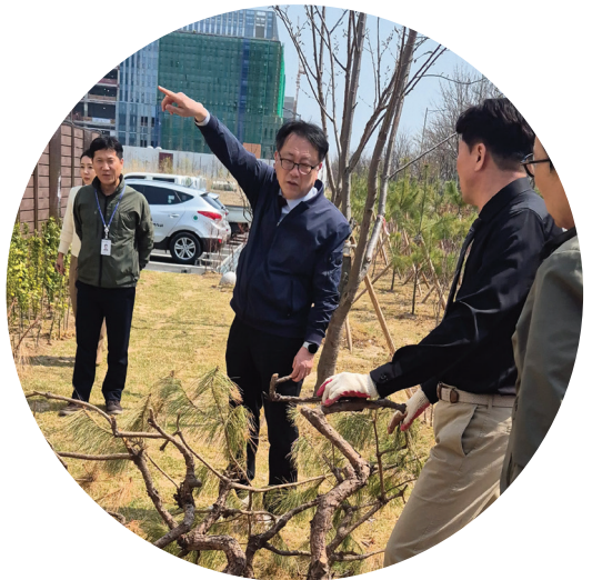
연수구 제2청사 환경개선

이제 시의원으로서 시민의 삶을 바꾸는 일에 나서고자 합니다. 송도국제도시는 연수구에 속해 있지만 주요 개발과 인허가는 인천시와 경제자유구역청이 담당하고 있습니다. 이로 인해 주민들께서 겪는 불편과 한계를 저는 현장에서 직접 확인해왔습니다. 이제 그 문제를 가장 잘 아는 사람이 해결하겠습니다. 인천시청과 연수구청에서 쌓은 행정 경험과 지식, 그리고 인적 네트워크를 바탕으로 송도의 산적한 현안을 하나씩 풀어내겠습니다. 시민의 목소리에 귀 기울이고 항상 한발 앞서 준비하는 정치인이 되겠습니다. 초심을 잃지 않고, 기본과 원칙을 지키며 주민 여러분과 함께 답을 찾겠습니다. 감사합니다.