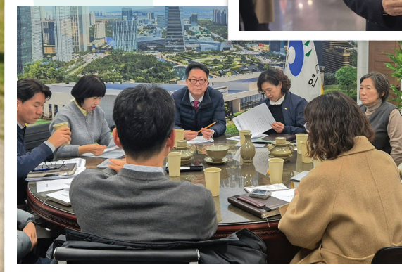
송도국제도시 현안상황 점검회의