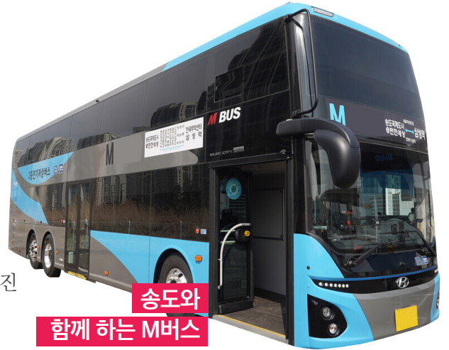
송도와 함께 하는 M버스