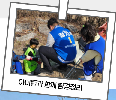
아이들과 함께 환경정리