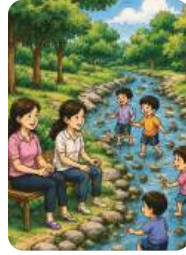
돌봄 품앗이 지원