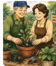
시니어클럽 지원 강화