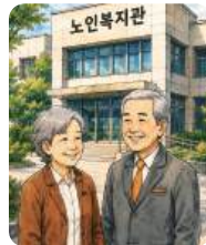
노인복지관 추가 조성