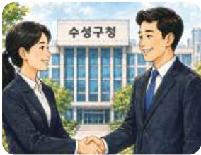
지역민 우선 채용