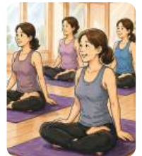
강좌 전용 공간 마련