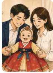
첫돌 촬영 지원