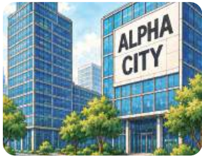
기업 유치 현황 점검