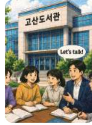
도서관 확충 영어프로그램 확대