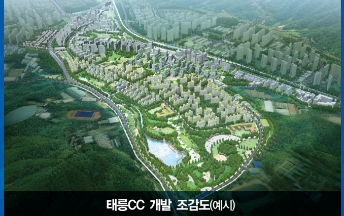
태릉CC 개발 조감도(예시)