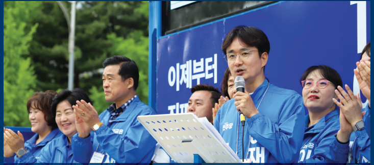
이재명 대통령과 함께 미래를 기획한 대통령 후보 직속 기후위기대응위원회 부위원장

더불어민주당에서 검증된 20년의 실력 '미래경제도시 노원' 을 완성하겠습니다!