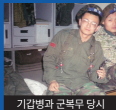
기갑병과 군복무 당시

평화로운 일상의 시작, 국군 장병 여러분의 헌신 덕분입니다. 고맙습니다.