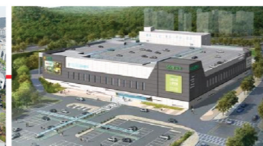
농협 하나로마트 복합유통센터 개발 추진