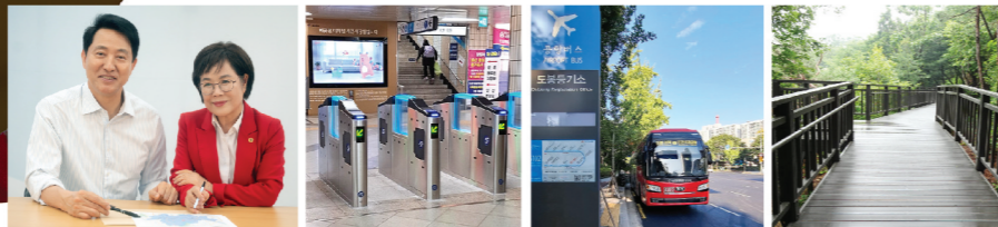
창동역노후 개집표기 교체 6102번 공항버스 신설 초안산 무장애 숲길 조성