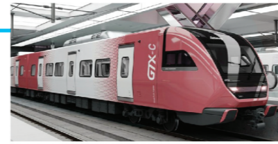
GTX-C 노선 신속 착공 추진