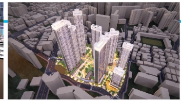
재건축·재개발 주민분담금 최소화