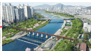
중랑천 수변공원 신설