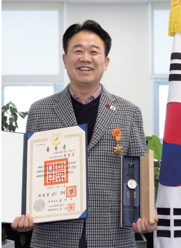
· 2025년 12월 31일 녹조근정훈장 수훈 (대통령 이재명)