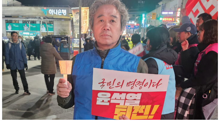
· 윤석열 정권 규탄 시위 · 사랑의 연탄 나르기