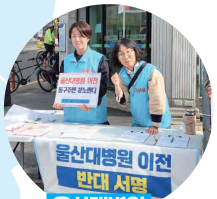
울산대병원 이전 반대