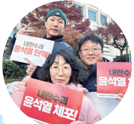
윤석열 파면 촉구활동