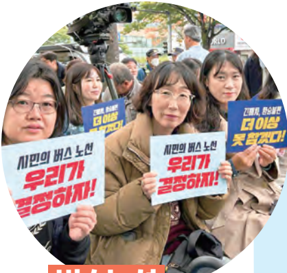
버스노선 개편 반대