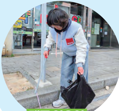
매주 일요일 쓰레기 줍기