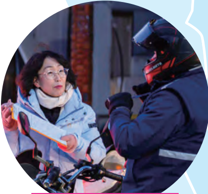
원하청 차별 없는 연말성과급 지급 촉구 서명운동