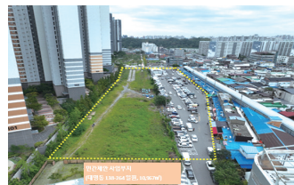
역전시장 주차장, 지역 상권·녹지축 보존을 위한 개발 공공성 강화 조정안 마련