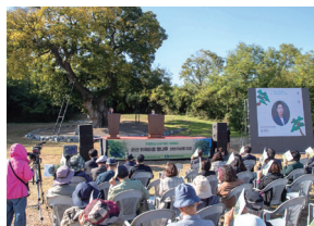
'600년 팽나무' 국가 지정 천연기념물 승격