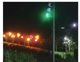
군여고 앞, 오색공원 조성