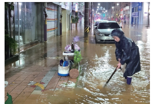
월명동 일대 하수관거 및 준설 정비예산 14억 확보