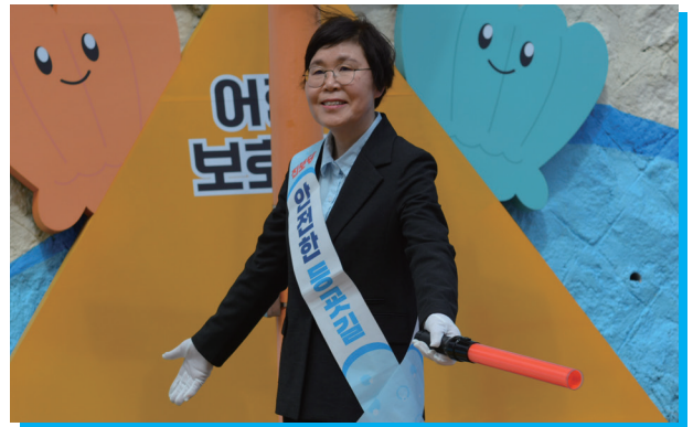
▲ 아이들의 안전한 등굣길을 지키는 사람