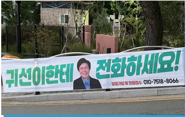
▲ 주민들의 이야기에 귀 기울이는 사람