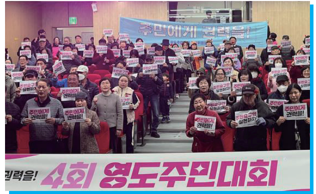
▲ 영도구 정치축제, 영도주민대회 조직위원회 운영위원