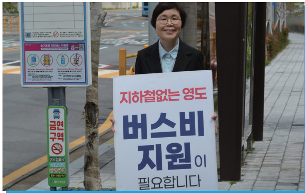
▲ 살기 좋은 영도를 만들기 위해 앞장서온 사람