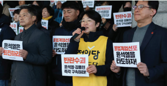
24년 12월 4일 기자회견 (12.3 계엄발표 다음 날 제주도청 앞)