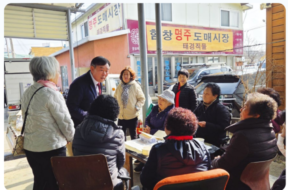
“말보다 행동으로 실천했습니다”