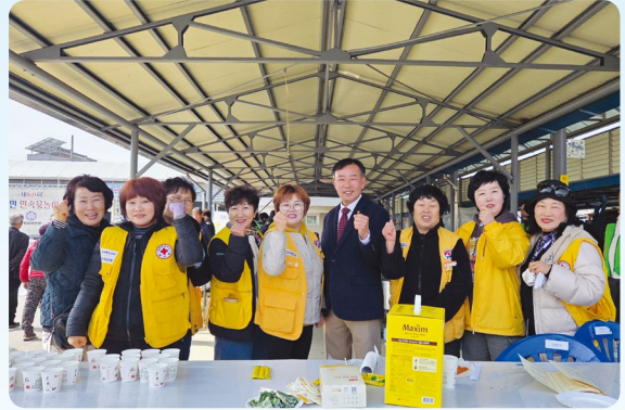
“현장에서 문제를 직접 확인했습니다”