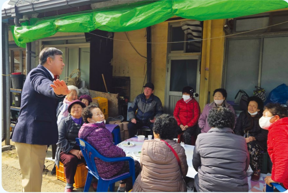
“주민의 이야기를 가장 가까이에서 들었습니다”