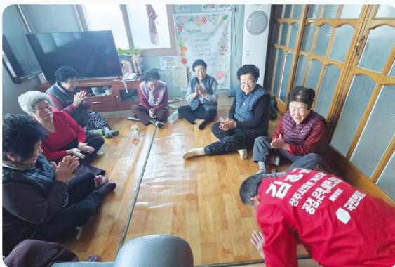
“필요한 곳에 먼저 효직했습니다”