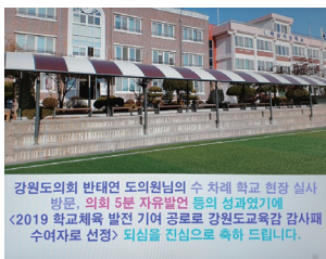
강원도의회 반태연 도의원의님 수 차례 학교 현장 심사 방문, 의회 5분 자유발언 등의 성과있기에 <2019 학교체육 발전 기여 공로로 강원도교육감 감사패 수여자로 선정> 되심을 진심으로 축하 드립니다.