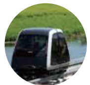
'수성못-들안길' 스카이택시 PRT(무인궤도택시) 설치