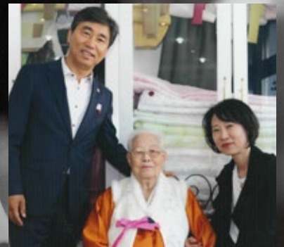
장모님 팔순을 준비하며(2018년)