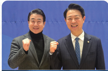
김영호 국회 교육위원장 독서국가 선포식