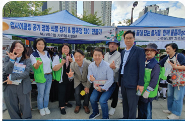
가재를 중앙근린공원 한가위 송편축제