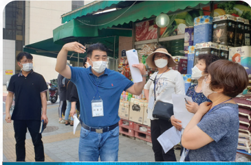
서대문구 주민참여예산 위원회 현장방문