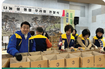
남가좌1동 지역사회보장협의체 설 선물 꾸러미 전달식