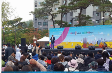
'가재에서 미래내까지, 남하나동 마을축제