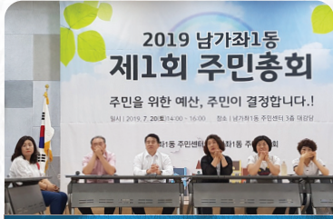
남가좌1동 제1회 주민자치회 주민총회