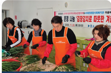
남가좌1동 지역사회보장협의체 김장김치로 따뜻한 온정나누기 행사