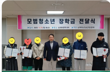
청소년지도협의회 모범청소년 장학금 전달식