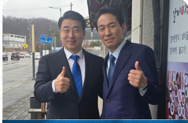
강원도지사 출판기념회 행사전