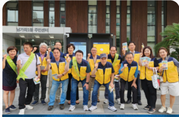
청소년지도협의회 유해업소 캠페인