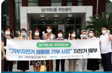
남가좌1동 주민자치회 기부자전거 재활용 기부사업