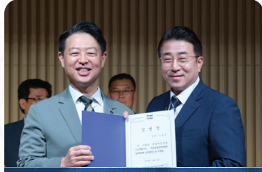
서대문(을) 블루위원회 임명장 수여식