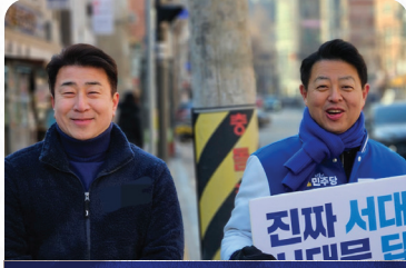
2024 제22대 총선