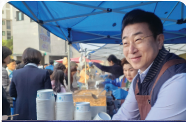
DMC파크뷰자이 은행나무 아나바다 행사