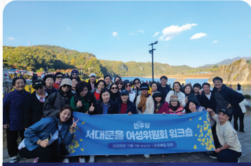
서대문을 여성위원회 워크숍