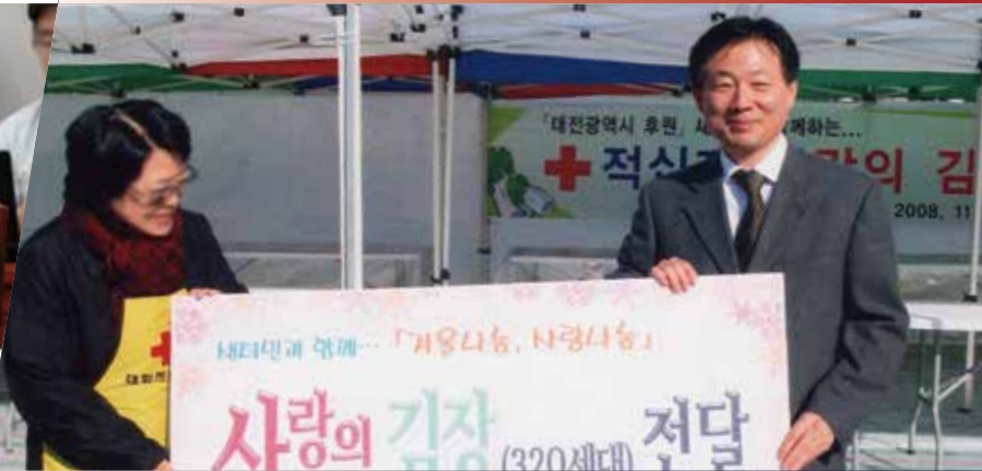
| 대전광역시 행정부시장 前