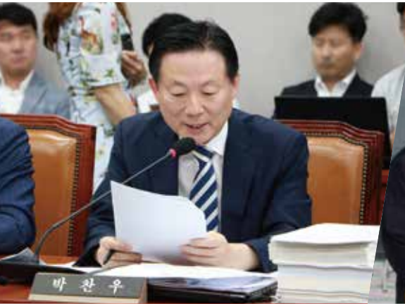
| 제20대 국회의원 前