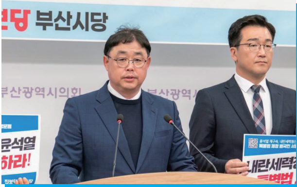
▲ 내란청산과 새로운 대한민국을 위해 앞장 선 광장의 대표일꾼