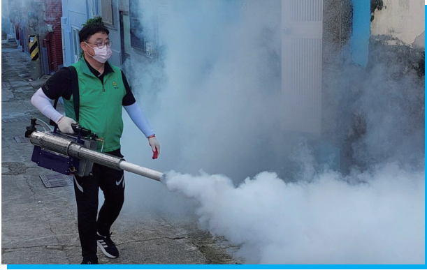
▲ 영도 구석구석, 방역통을 메고 발로 뚫은 진심의 발걸음