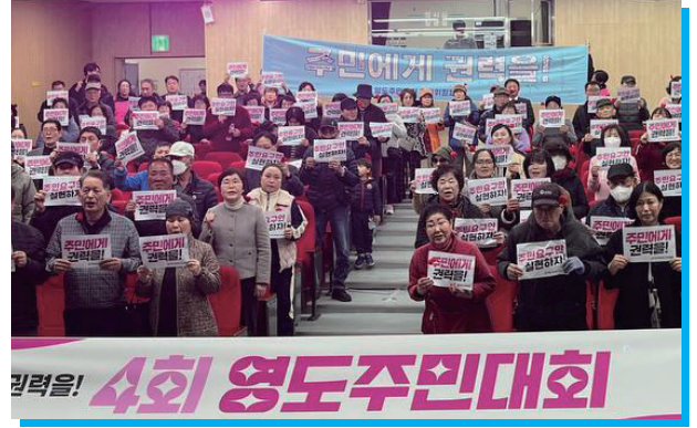
▲ 주민과 함께 영도를 바꿔 온 든든한 전문가