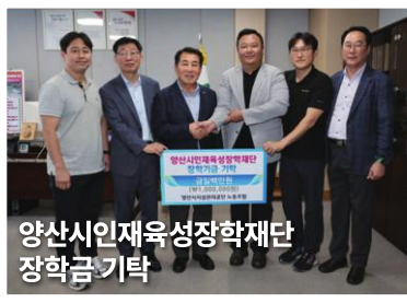
양산시인재육성장학재단 장학금 기탁