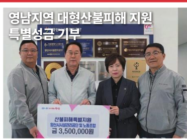
영남지역 대형산불피해 지원 특별성금기부