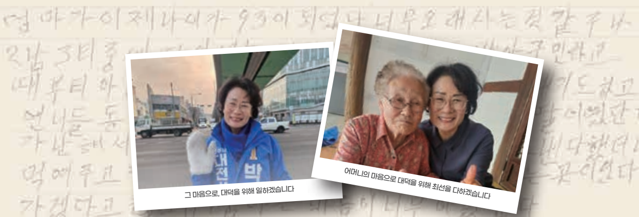
그 마음으로, 대덕을 위해 일하겠습니다