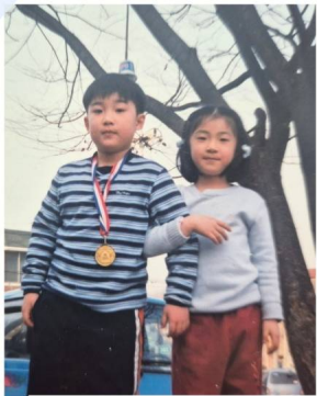
내가 태어난 수궁동에서