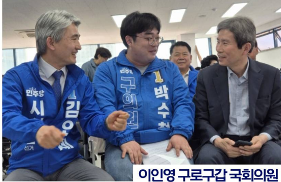
이인영 구로구갑 국회의원