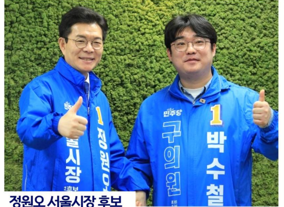
정원오 서울시장 후보