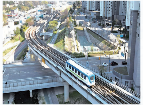
▲ 양지읍 : 용인경전철 연장 추진