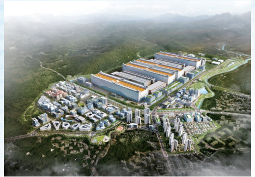
▲ 원삼면 : SK하이닉스 조성에 따른 지역 상생 합리화 방안 마련