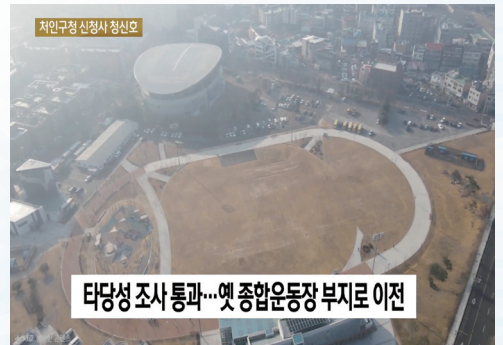
▲ 동부동 : 처인구청 이전 조기 착공