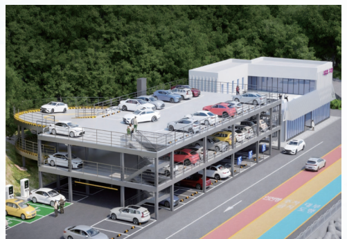
▲ 백암면 : 공영주차장 추진