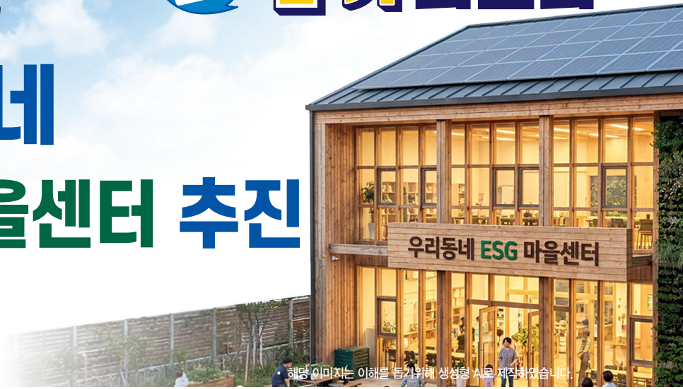
해당 이미지는 이해를 돕기 위해 생성형 AI로 제작하였습니다.