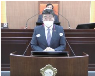
2022년 4월 1일 제276회 북구의회 5분 자유발언