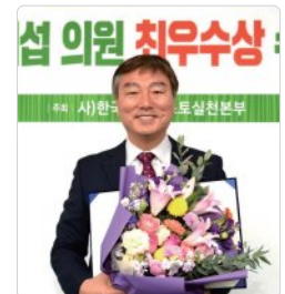
2020년 한국 매니페스토 약속대상 최우수상 (공약이행 부문, 호남권 지방의원 중 유일하게 수상)