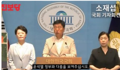
2025년 7월 10일 국회 기자회견