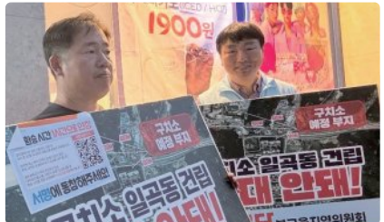
2025년 10월 13일 서명운동