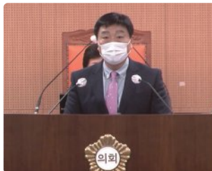
2021년 10월 18일 제273회 북구의회 임시회 구정질문