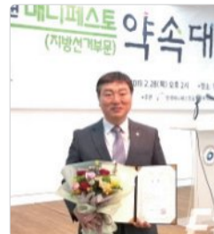
2018년 한국매니페스토 약속대상 우수상 (지방선거 부문)