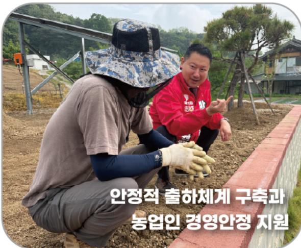
안정적 출하체계 구축과 농업인 경영안정 지원