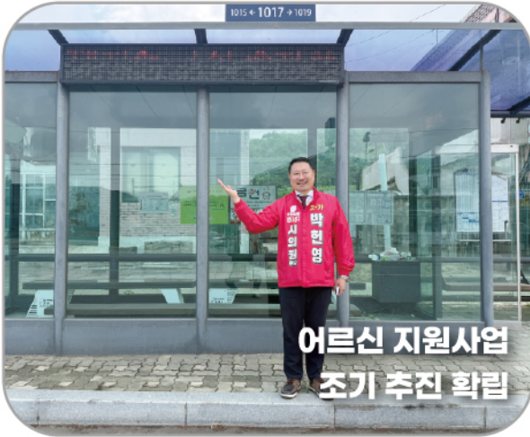
어르신 지원사업 조기 추진 확립