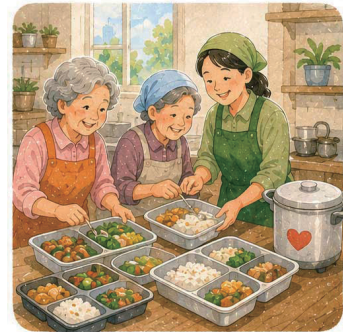
7. 어르신들을 위한 ‘효(孝) 도시락’ 부역