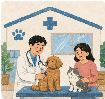
8. 반려인들을 위한 ‘익산시립반려동물병원’ 건립