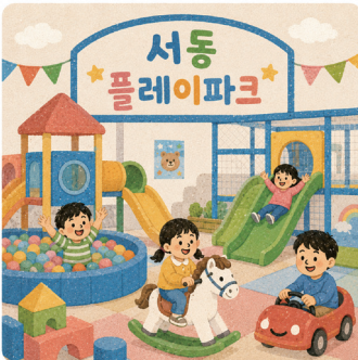
5. 익산 어린이들을 위한 ‘서동 플레이파크’ 건립