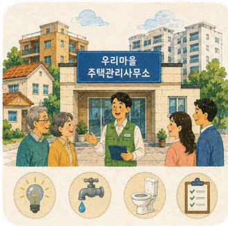
2. 단독주택을 관리해주는 ‘우리마을 관리사무소’ 설립