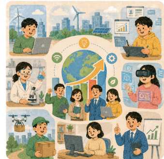
4. 미래형 워라밸 일자리·일거리 1,000개 창조