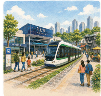
10. 역사와 현대가 공존하는 K-컬처로 익산역세권 개발명