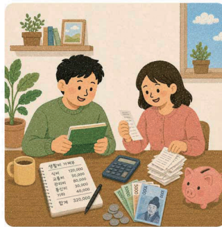
3. 생활비를 낮춰 드리는 월 ‘30만 원’ 살림패키지 제공