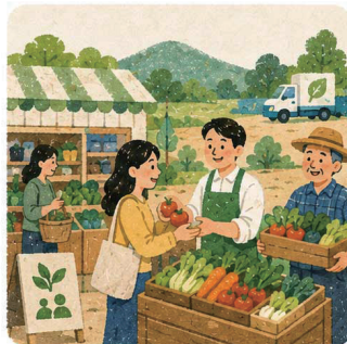
9. 농촌과 도시가 상생하는 로컬푸드직매장 확대