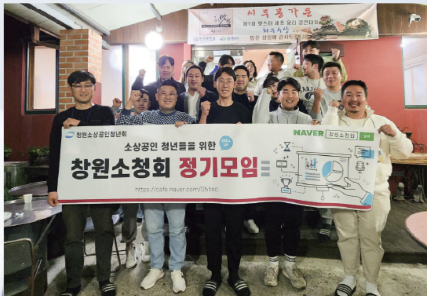
▲ 창원소상공인청년회 회의 개최