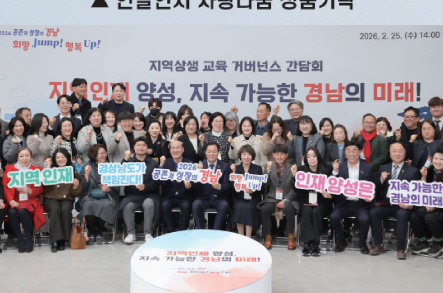
▲ 도지사에게 진해지역 교육문제 질의