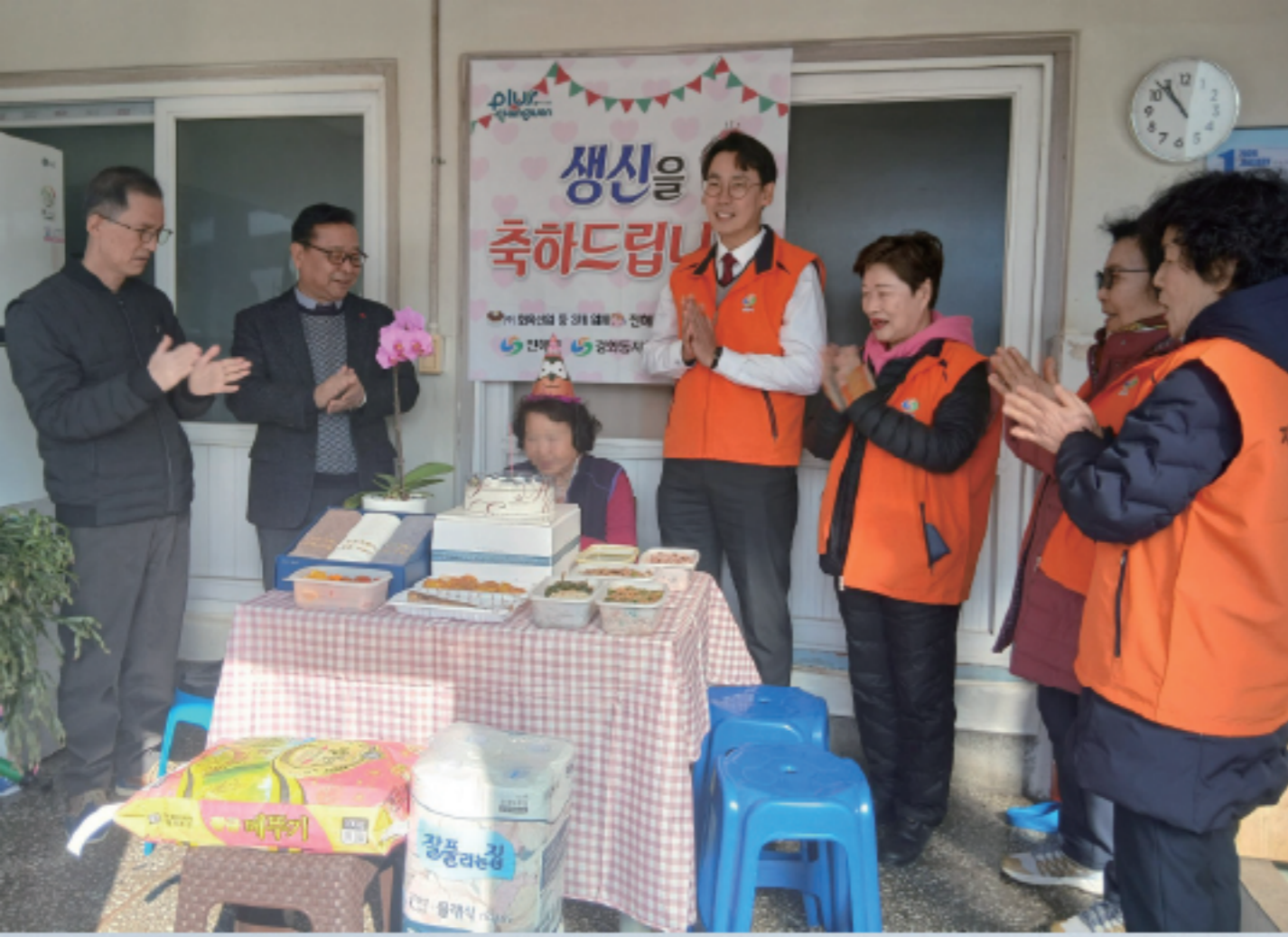
▲ 경화동거주 독거어르신 생신잔치