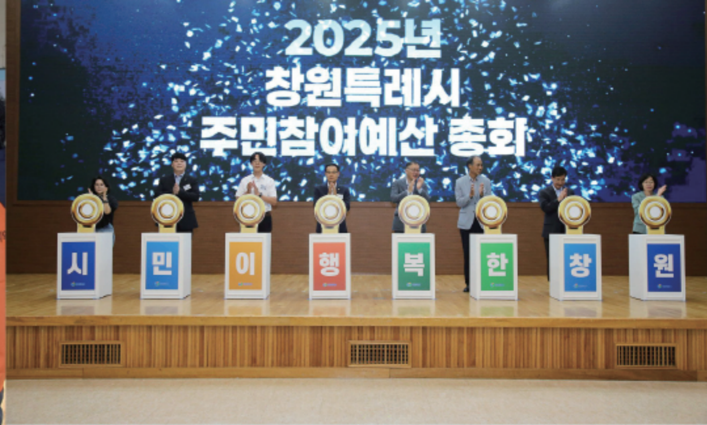
▲ 주민참여예산 대표발의