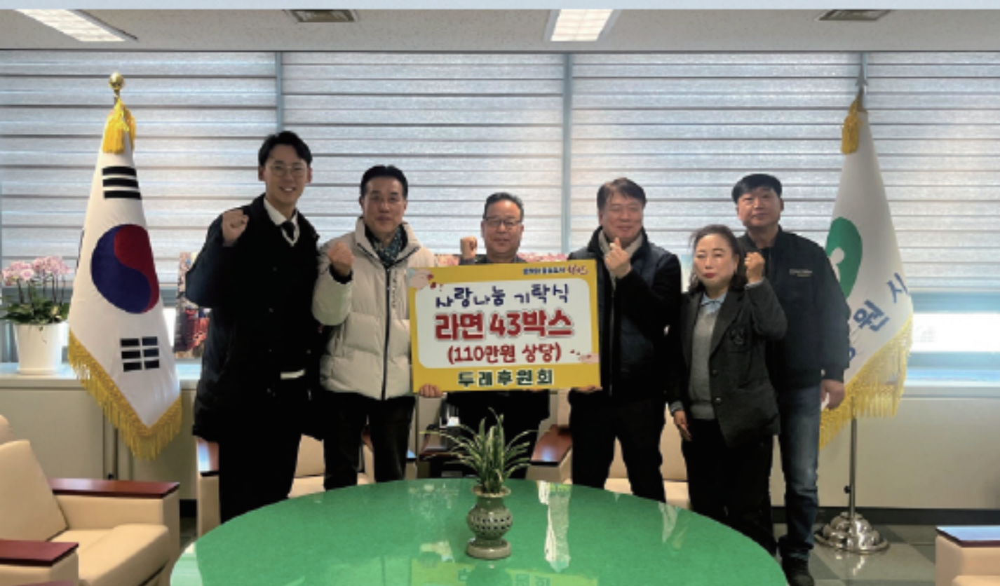
▲ 연말연시 사랑나눔 상품기탁