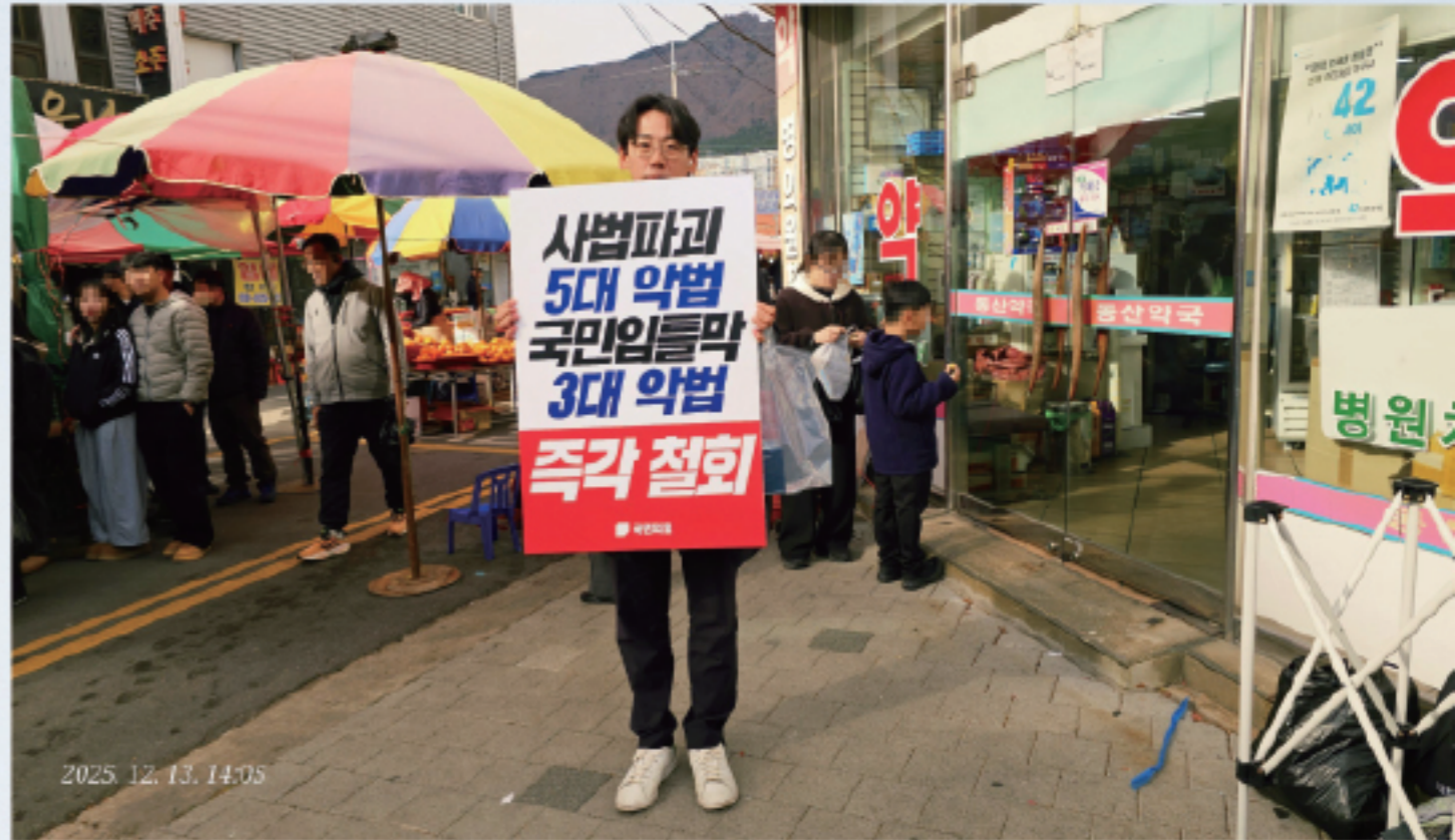
▲ 사법파괴 반대 1인 시위