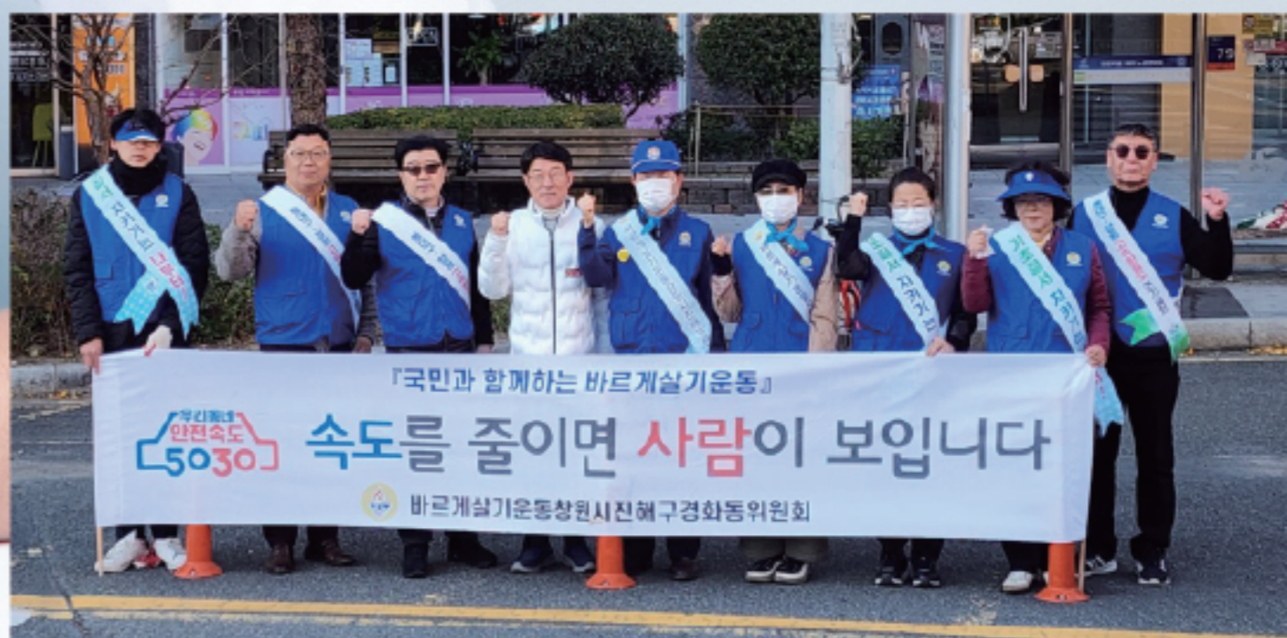
▲ 바르게살기 법질서 캠페인