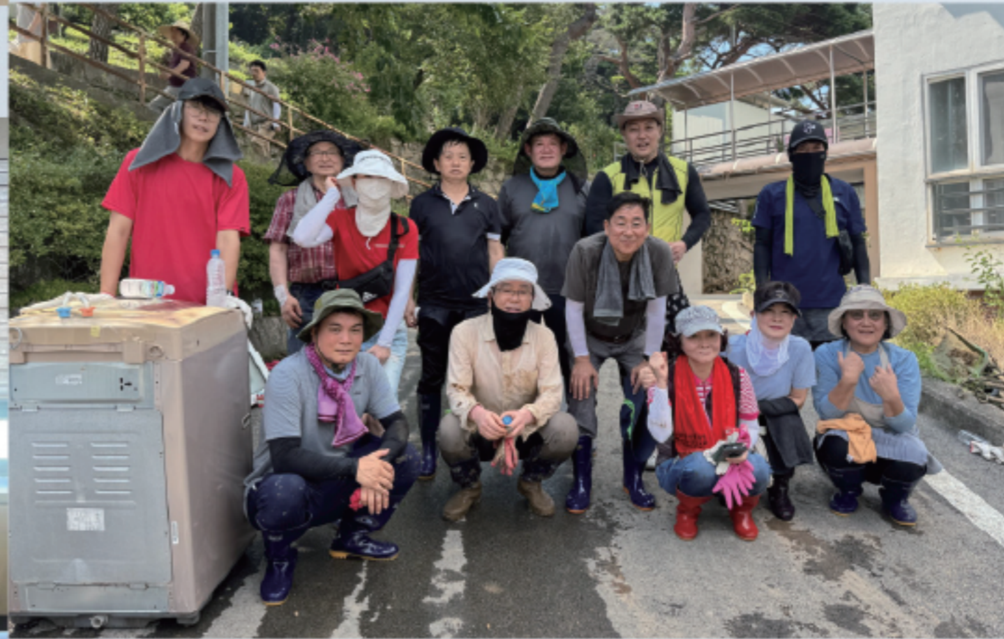
▲ 산청수해지역 봉사