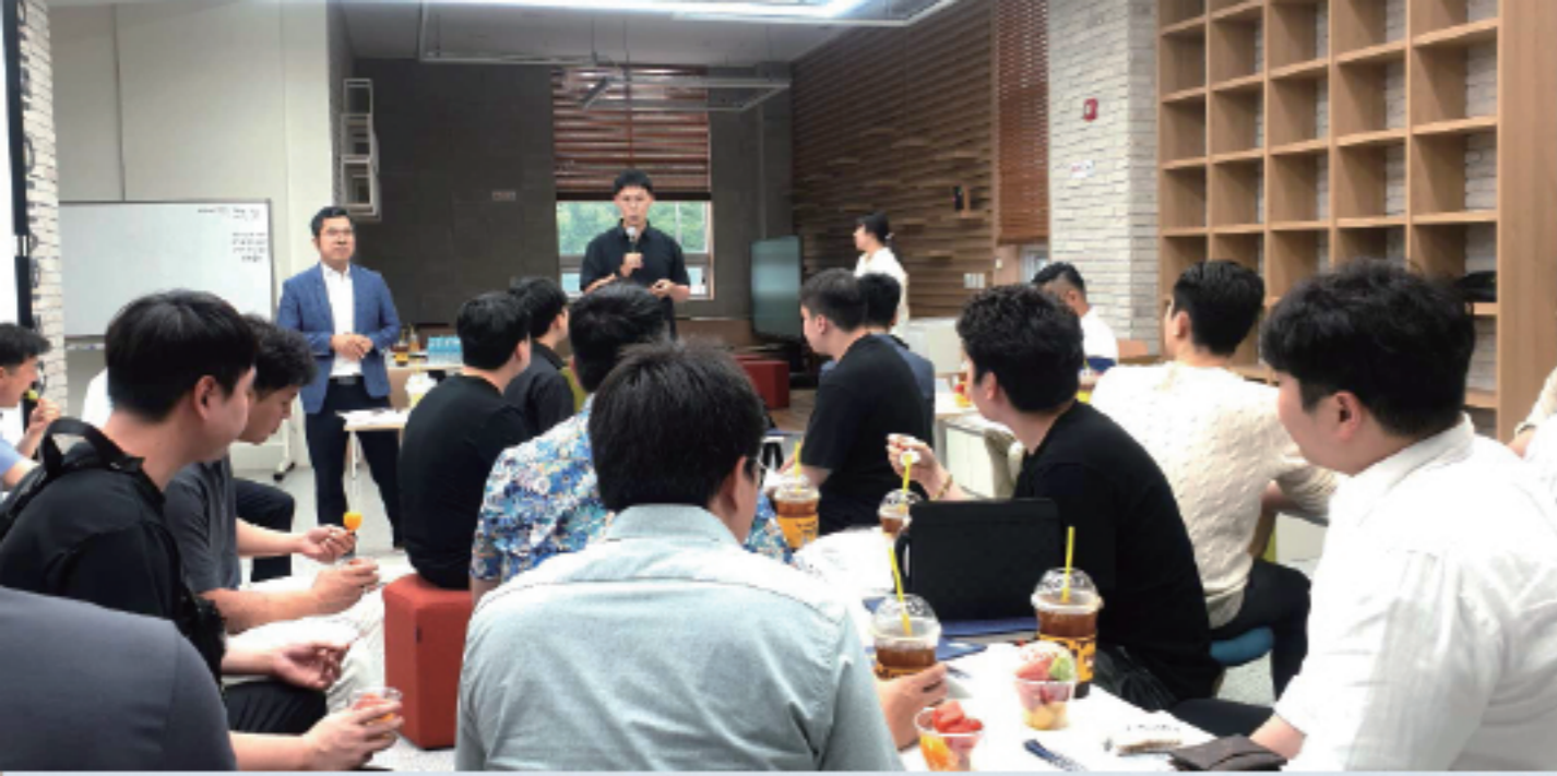
▲ 마산대학교 청년창업자반 대표 연설