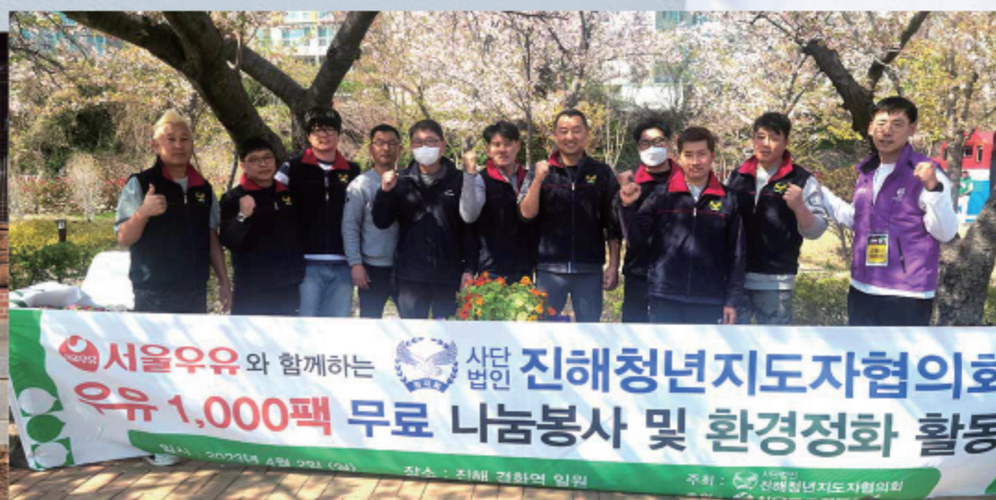
▲ 군항제 기간 우유 나눔봉사