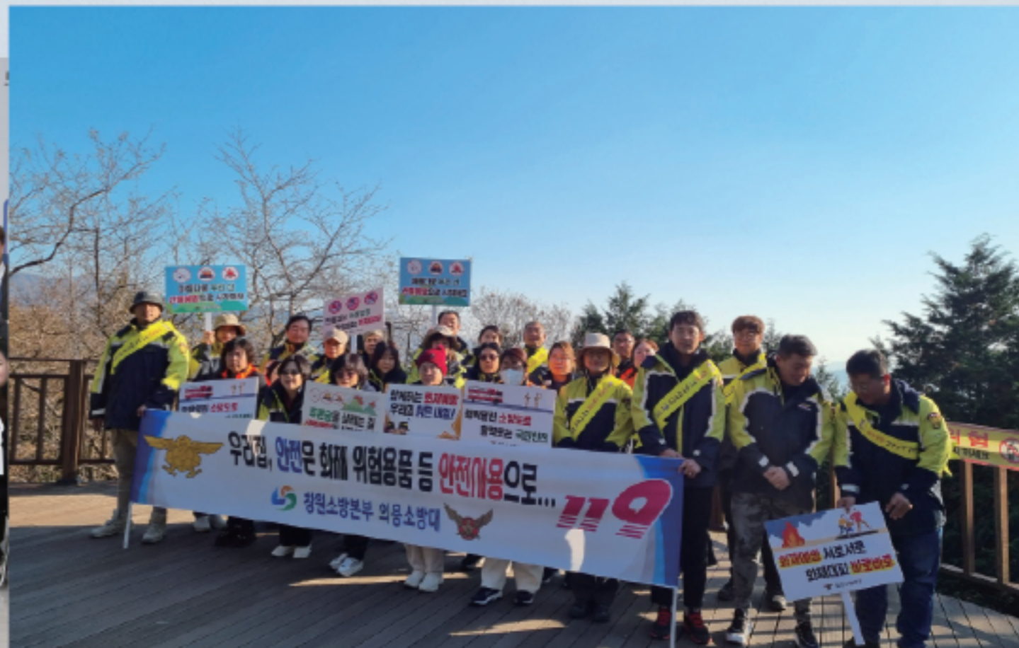
▲ 의용소방대 캠페인