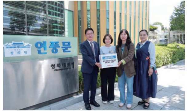
팽성 고도제한구역 완화를 위한 청와대 민원접수