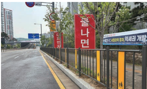
헤스티블 어린이보호구역 안전펜스 설치 민원 해결