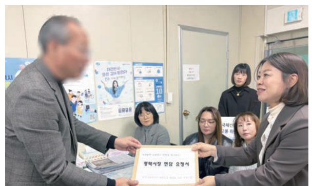
학생통학 순환버스 도입을 위한 5,000여 명 주민 서명 전달