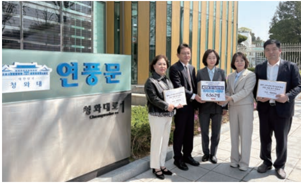
KTX남부역사 설치를 위한 청와대 민원접수