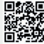
후보자가 살아온 길