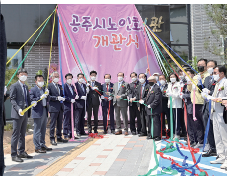
도시재생사업 현장 점검