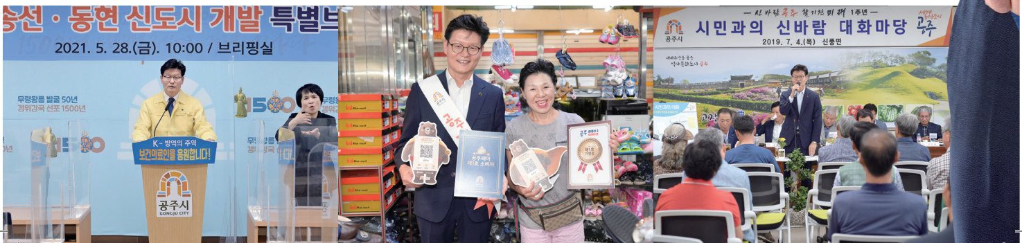
읍면동별 시민과의 대화(연2회)