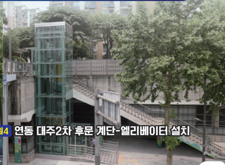
민원4 연동 대주2차 후문 계단-엘리베이터 설치