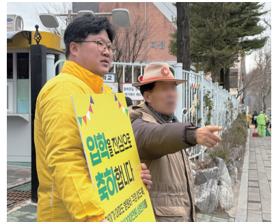
안전한 통학로, 함께 고민하겠습니다