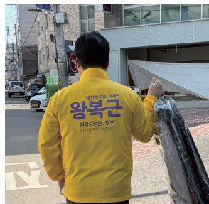
선거 중에는 빨라가 많이 나온답니다