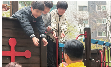
아이들이 정말 좋아하는 왕복근