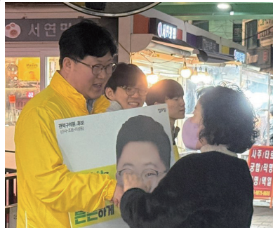
“이번엔 될 거예요!”

정부와 국회가 밑그림을 그린다면, 구의회는 그림을 실제 삶으로 완성합니다. 동네마다 사는 사람도, 불안의 모양도, 필요한 서비스도 다릅니다. 그래서 지방자치가 제대로 서고, 구의원이 제대로 서야 합니다. 지방선거는 ‘작은 선거’가 아닙니다. 오히려 내 삶에 가장 가까운 선거입니다.