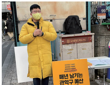
"안 쓰고 남는 예산, 꼭 필요한 주민들에게!"