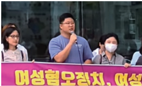
"여성안심귀갓길 예산 삭감을 규탄한다!"

여기서 지내며 눈에 밟히는 이웃들이 있었습니다. 혼자 사시는 어르신들, 외로움을 버티는 청년들, 아이가 놀 곳을 찾아 헤매는 부모님들, 밤길이 겁나 큰 길로 돌아가는 친구들. 이웃들이 마음 편하게 함께 살았으면 좋겠습니다.