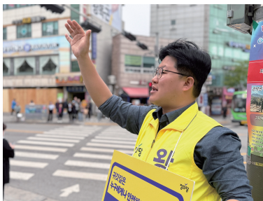
"오늘도 좋은 하루 되세요!"