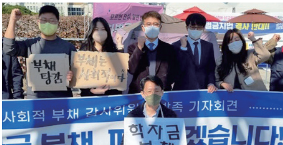
빛 지고 시작하는 사회생활, 저도 겪었습니다