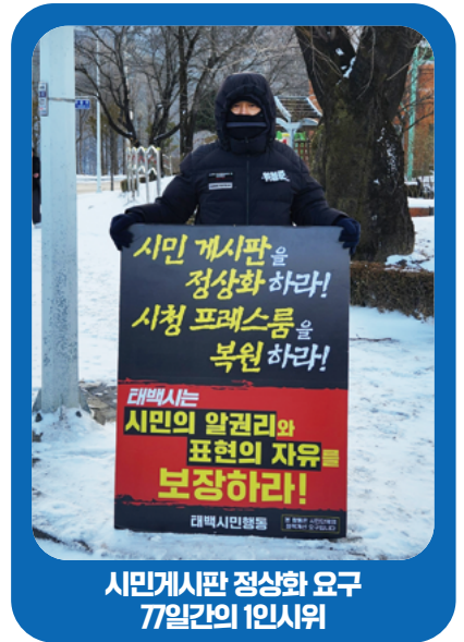
시민게시판 정상화 요구 77일간의 1인시위