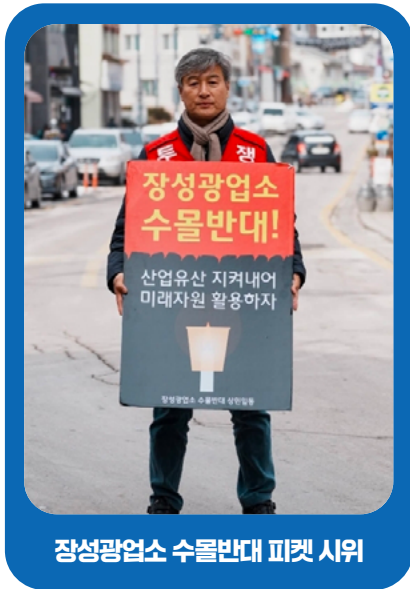
장성광업소 수몰반대 피켓 시위