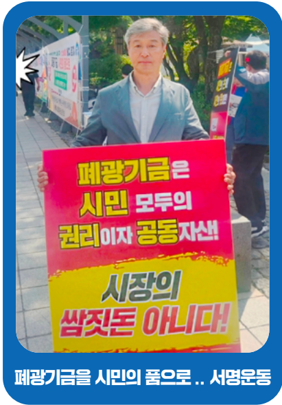
관광기금을 시민의 품으로 .. 서명운동