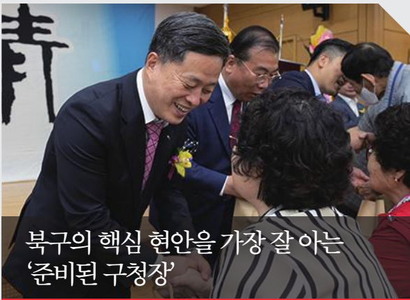
북구의 핵심 현안을 가장 잘 아는 '준비된 구청장'

북구 부구청장을 거치며 33년간 탁월한 행정 능력을 검증받았습니다. 조직 관리부터 예산 편성까지 구정 전반을 이미 완벽하게 꿰뚫고 있어, 당선 직후 업무 파악에 시간을 허비할 필요 없이 취임 첫날부터 즉각 실무에 돌입할 수 있는 '준비된 구청장'입니다.