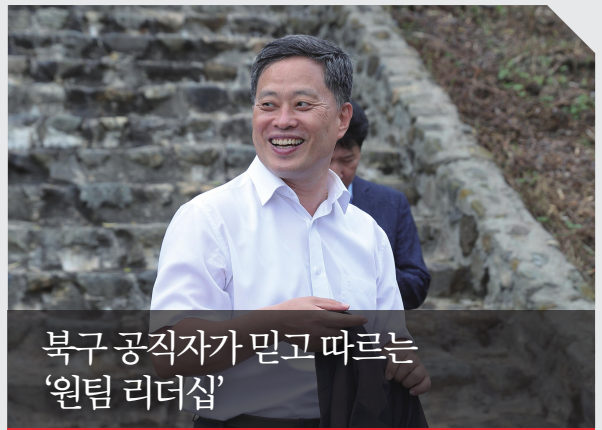
북구 공직자가 믿고 따르는 '원팀 리더십'

부구청장 재임 시절 교통 체증 해소, 노후 도심 재생, 촘촘한 복지 인프라 구축 등 북구의 핵심 현안을 최일선에서 직접 지휘했습니다. 밖에서 바라본 탁상공론이 아니라 직접 결재하고 현장을 누비며 완성해 온 '즉각 실행 가능한 로드맵'으로, 북구의 해묵은 과제들을 신속하게 풀어내겠습니다.