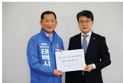
진성준 국회 예결위원장 태백교도소 국비증액 촉구