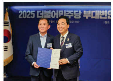
민주당 부대변인 임명식