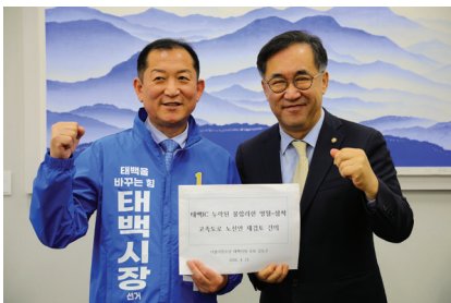
맹성규 국회 국토위원장 태백 IC 신설 건의

석탄산업의 수도, 태백에서 사라진 광부의 기억을 소중하게 피어 올리겠습니다