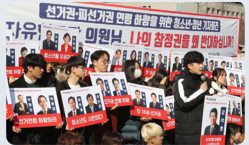
-선거권·피선거권 연령 하향을 위한 청소년·청년 기자회견(2019.01.29.)-

만18세 유권자 여러분의 생애 첫투표를 축하합니다! 청년이 행복한 양주를 위해 소중한 한 표를 꼭 행사하시기 바랍니다.