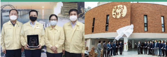
울산시장, 시·구의원을 비롯한 북구청 공무원과 함께 노력한 주요사업의 결과입니다.