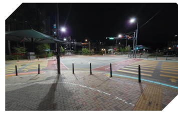
양지초 사거리 바닥신호등