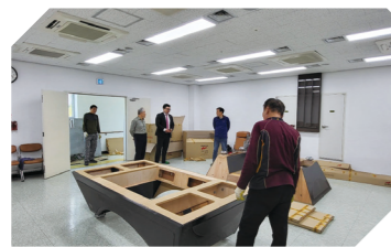
노인문화센터 당구실 증설 및 냉난방기 추가설치