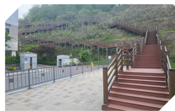
늘봄산 보행약자용 데크산책로 설치