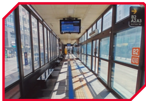
BRT정류장 상행·하행 냉난방기 설치