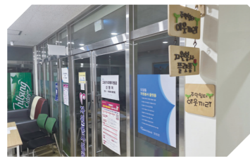
도담동 직능단체 휴게공간