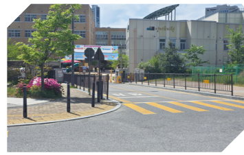
양지초 앞 안전펜스 설치