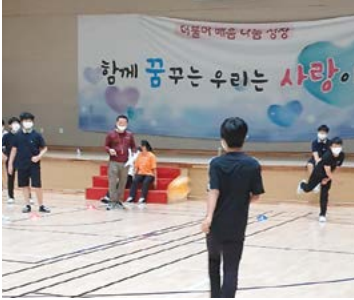
설온중학교 1학년 담임 시절, 학생들과 함께 한 체육수업