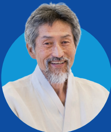
강기갑 (전 국회의원)

“사천의 자부심을 세울 강직한 우리 후보” “평생 정의와 공정을 지켜온 정국정은 참으로 든든한 사람입니다. 시민의 권익을 끝까지 지켜낼 우리 국정이에게 사천의 미래를 믿고 맡겨주십시오.”